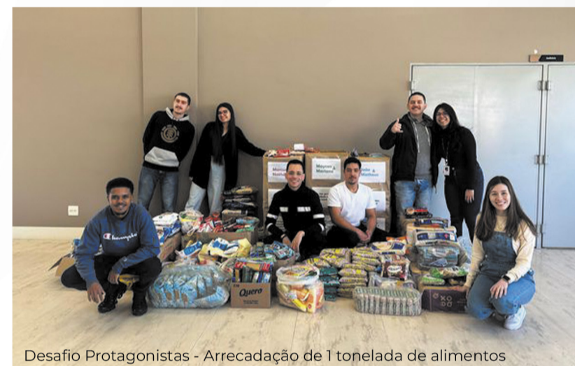
Desafio Protagonistas - Arrecadação de 1 tonelada de alimentos

Além dessas ações específicas, a Cooperemb também realizou a arrecadação de agasalhos e cobertores para a Campanha do Agasalho 2023 e lives de orientação para o programa Voluntários Transformadores para seus colaboradores. Essa iniciativa visa capacitar os membros da cooperativa para que possam exercer um papel ativo na transformação social, fortalecendo assim os princípios do cooperativismo. A Semana do Cooperativismo na Cooperemb foi marcada pela solidariedade, engajamento e a valorização do trabalho voluntário como um meio de impactar positivamente a comunidade. A cooperativa reafirma seu compromisso em promover ações que beneficiem a sociedade e destaca a importância do cooperativismo como um instrumento de mudança e desenvolvimento sustentável.