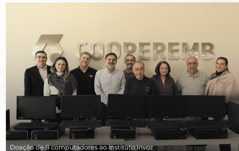
Doação de 8 computadores ao instituto Invoz