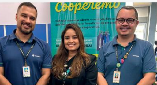
Unidade Embraer Botucatu

A programação contou ainda com a realização de uma pesquisa de opinião, fortalecendo o diálogo com os cooperados e contribuindo para o aprimoramento contínuo dos produtos e serviços. A participação na Feira de Benefícios reafirma o posicionamento da Cooperemb como uma parceira próxima, que busca oferecer soluções acessíveis, orientação especializada e apoio às conquistas pessoais e profissionais de seus cooperados.