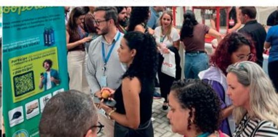
Unidade Embraer EGM