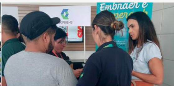
Unidade Embraer Sorocaba