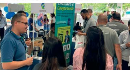
Unidade Embraer ELEB