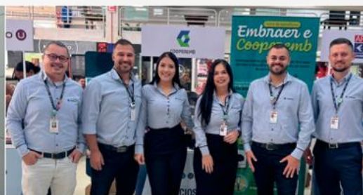
Unidade Embraer F91