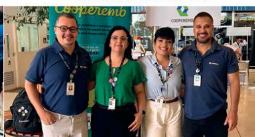
Unidade Embraer GPX